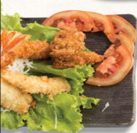
42 Bánh tôm và rau chiên Kakiage