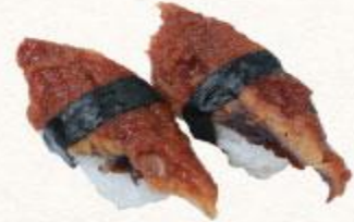
102 Sushi cá Sanma Kabayaki Sanma kabayaki