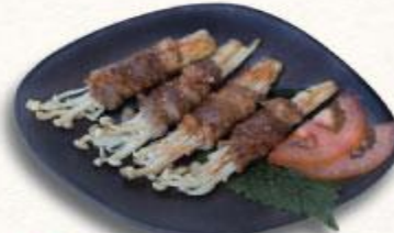
20 Bò cuộn nấm nướng Gyuniku to enokimaki