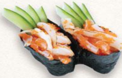
107 Sushi mực nướng tái và ebiko Aburi ika to ebiko