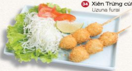
34 Xiên Trứng cút chiên xù Uzuna furai