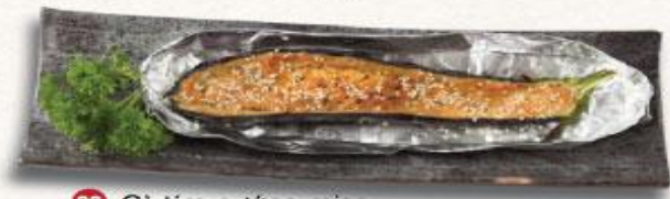
28 Cà tím nướng miso Nasu miso yaki