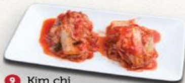
9 Kim chi Kimuchi