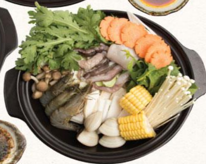
66 LẤU KIM CHI HẢI SẢN Kaisen Kimchi Nabe