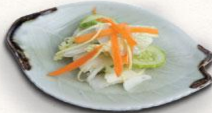
4 Dưa muối kiểu Nhật Tsukemono