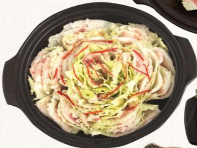
65 LẤU CẢI THẢO & THỊT HEO Butaniku to hakusai nabe