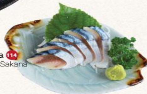
114 Cá Saba Shiromi Sakana