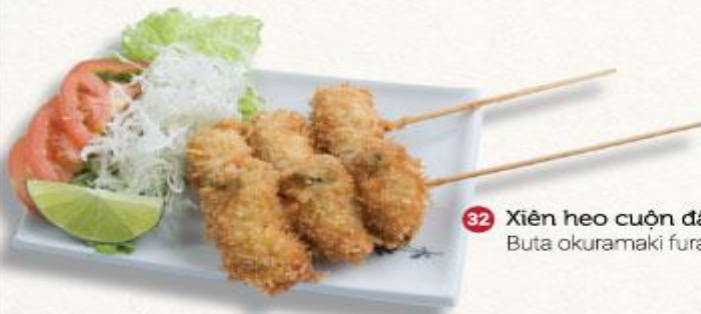
32 Xiên heo cuộn đầu bắp chiên xù Buta okuramaki furai