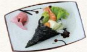
83 Tôm chiên sốt mayo Ebifurai mayo