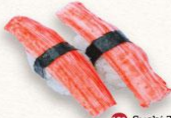
101 Sushi Thanh Cua Kanikama