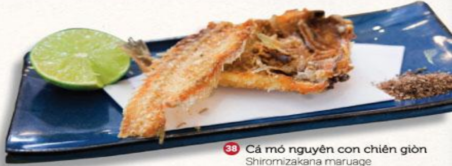
38 Cá mó nguyên con chiên giòn Shiromizakana maruage