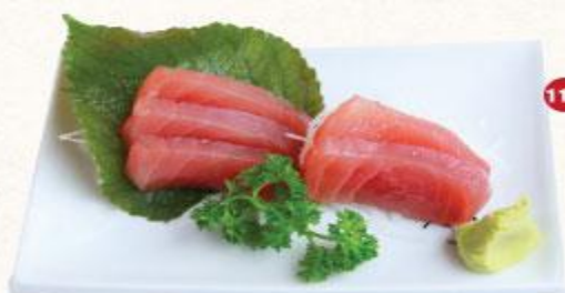
110 Cá ngừ Maguro