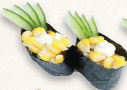
103 Sushi bắp trộn mayo Corn mayo