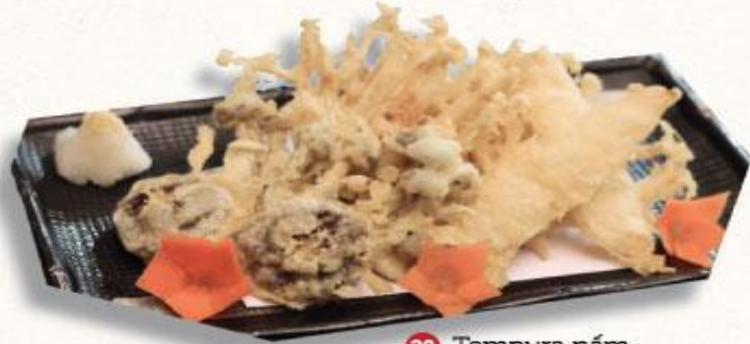
29 Tempura nấm Kinoko Tempura