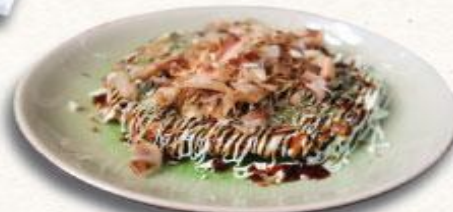
25 Bánh xèo kiểu Nhật Okonomiyaki