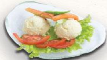
5 Xà lách khoai tây Potato Salad