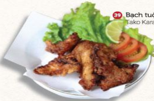
39 Bạch tuột chiên giòn Tako Karaage