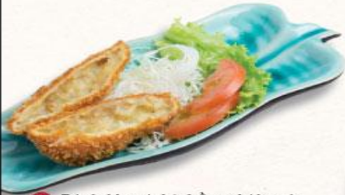
37 Bánh khoai thịt băm chiên xù Korokke