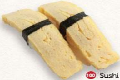
100 Sushi Trứng Tamago