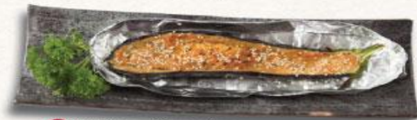
28 Cà tím nướng miso Nasu miso yaki

AOI sẽ tính phụ thu 100.000VND/100g thức ăn thừa. Mong quý khách hãy sử dụng hết thức ăn đã order