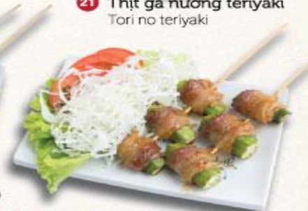
24 Xiên heo cuộn đậu bắp nướng Buta to okura maki