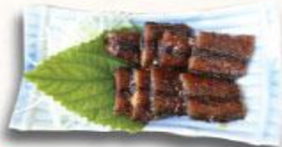
16 Cá Sanma nướng kiểu Kabayaki Sanma Kabayaki