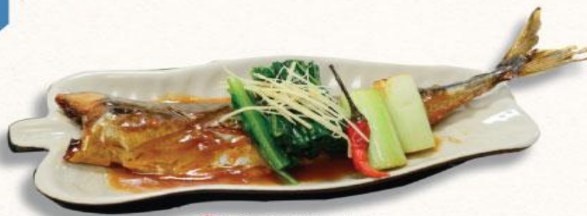
44 Cá saba kho miso Saba miso ni