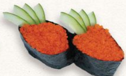
108 Sushi trứng tôm Ebiko