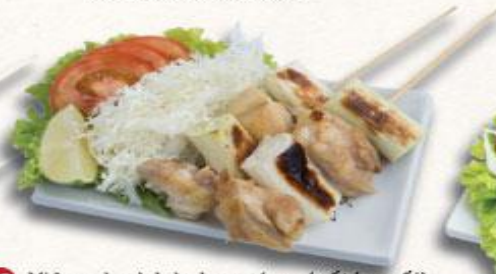
23 Xiên gà và hành nướng (sốt/muối) Negima