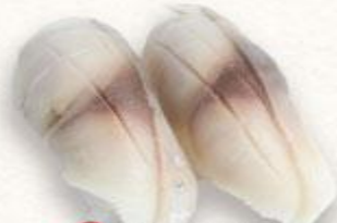
98 Sushi cá saba Saba