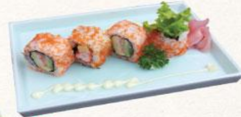
83 Cơm cuộn kiểu Cali California roll