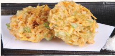
42 Bánh tôm và rau chiên Kakiage