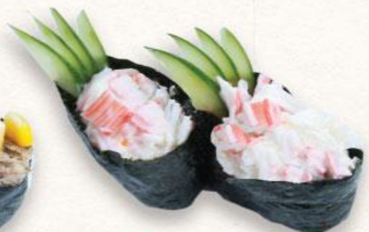
105 Sushi thanh cua mayo Kanikama mayo