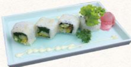
81 Cơm cuộn rau củ Vegetables roll