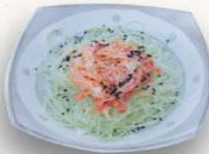
7 Xà lách dưa leo với thanh cua cay Kani kama to kyuri