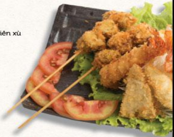
36 Set chiên xù tổng hợp 4 loại Furai Moriawase