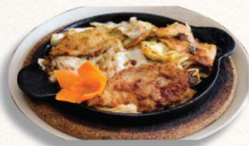
49 Thịt heo xào bắp cải sốt gừng Buta no shogayaki