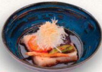
6 Đậu hũ chiên sốt kiểu Nhật Agedashi tofu