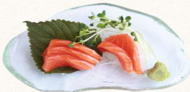
109 Cá hồi Salmon

Giới hạn: 5 miếng sashimi/ khách. Quý khách có thể chọn 1 món trong các món dưới đây Limit: 5 pieces sashimi/customer. Please order one of below dishes