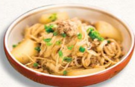
45 Thịt gà băm kho củ cải và miến Hiikiniku to daikon ni