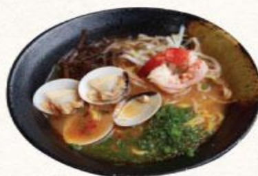
55 Mì ramen hải sản cay Kaisen ramen