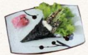
91 Cá trứng chiên sốt ngọt Shisyamo furai