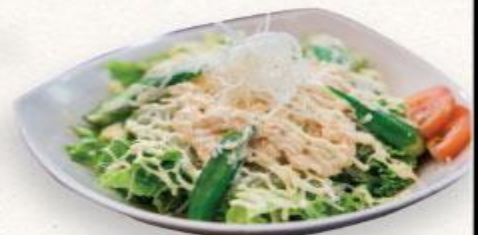
14 Xà lách cá ngừ mayo Tuna mayo salad

AOI sẽ tính phụ thu 100.000VND/100g thức ăn thừa. Mong quý khách hãy sử dụng hết thức ăn đã order