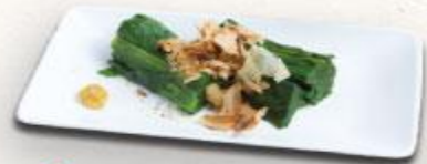
11 Bò xôi luộc ăn với cá bào Ohitashi