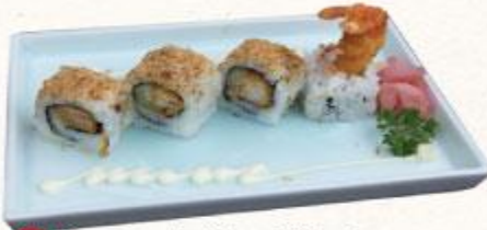
78 Cơm cuộn tôm chiên xù Ebifurai roll