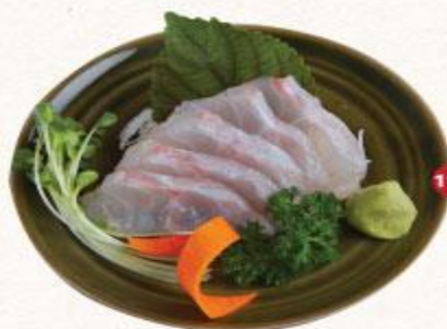
113 Cá trắng Shiromi Sakana