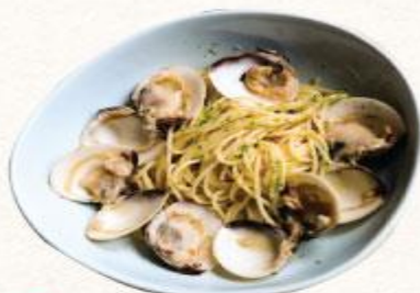
54 Mì ý xào nghêu kiểu nhật Hamaguri pasta