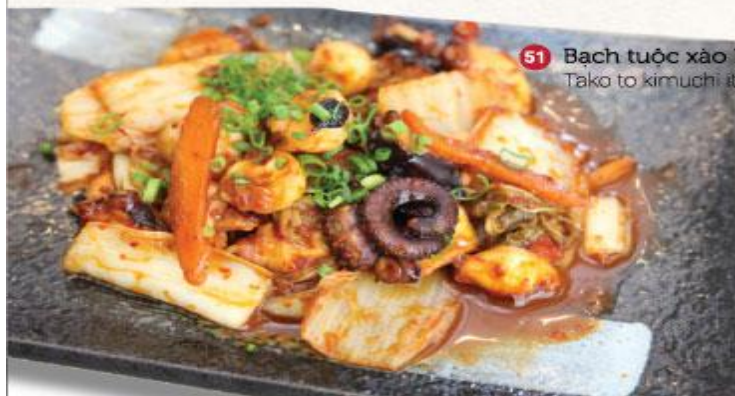
51 Bạch tuộc xào kim chi Tako to kimuchi itame