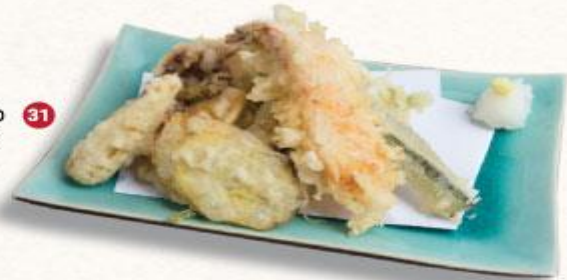
31 Tempura tổng hợp Tempura Moriawase