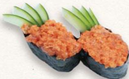
106 Sushi cá ngừ cay Spicy Tuna