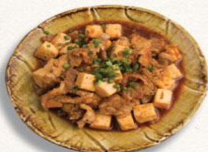
48 Thịt heo xào đậu hủ sốt cay Butaiku to tofu pirikara itame