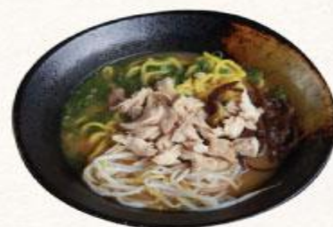
56 Mì ramen gà Miso Tori Miso ramen