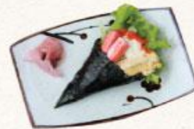
90 Thanh cua và trứng Kanikama to tamago