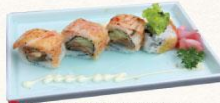
79 Cơm cuộn thịt nướng kim Butakimuchi roll