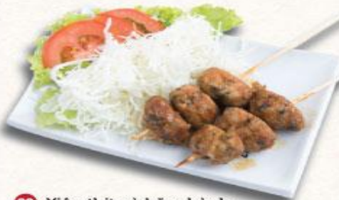
22 Xiên thịt gà băm hành Tukune kushi