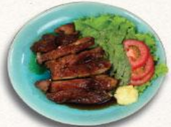
21 Thịt gà nướng teriyaki Tori no teriyaki