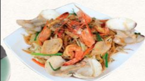
57 Mì xào hải sản sốt cay Spicy kaisen Yakisoba