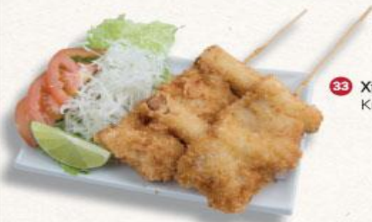
33 Xiên thịt heo chiên xù Kushikatsu