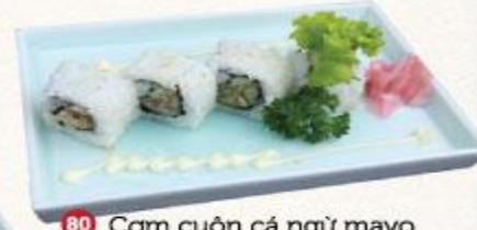
80 Cơm cuộn cá ngừ mayo Tuna mayo roll