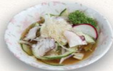
8 Bạch tuộc trộn dấm Takosu