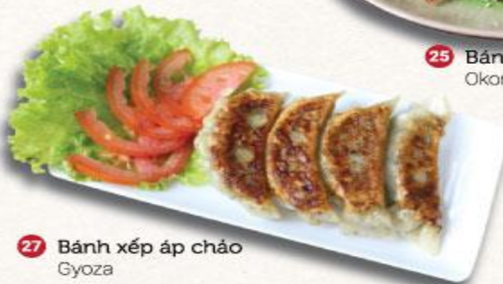
27 Bánh xếp áp chảo Gyoza