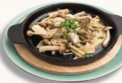
50 Hào xào nấm bơ tỏi Kaki to kinoko bata itame