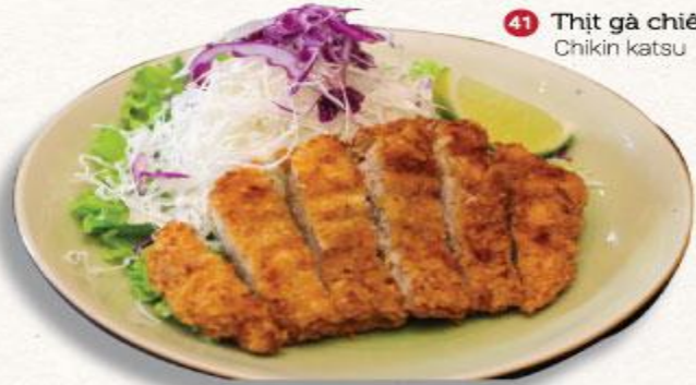
41 Thịt gà chiên xù Chikin katsu