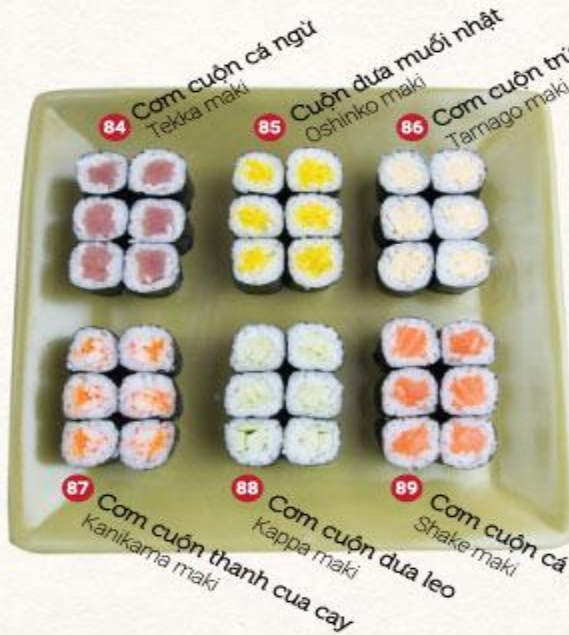
84 Cơm cuộn cá ngừ Tekka maki