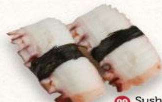
99 Sushi bạch tuộc Tako