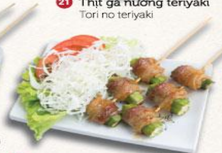
24 Xiên heo cuộn đậu bắp nướng Buta to okura maki