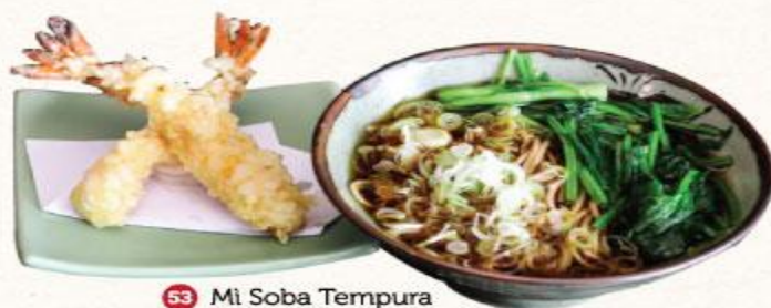
53 Mì Soba Tempura Soba tempura