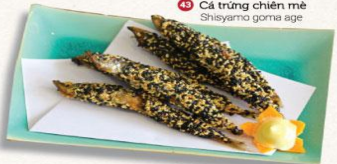
43 Cá trứng chiên mè Shisyamo goma age

AOI sẽ tính phụ thu 100.000VND/100g thức ăn thừa. Mong quý khách hãy sử dụng hết thức ăn đã order