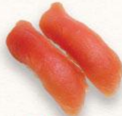
95 Sushi cá ngừ Maguro