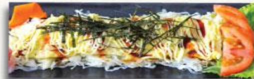
26 Trứng cuộn thịt heo Tonpeiyaki