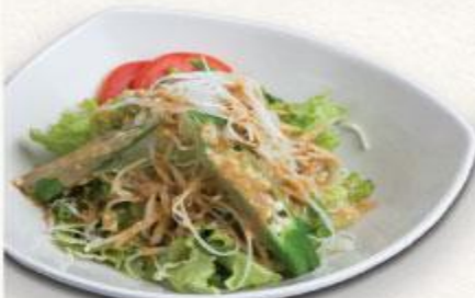
12 Xà lách tổng hợp sốt mè Green salad/goma sauce