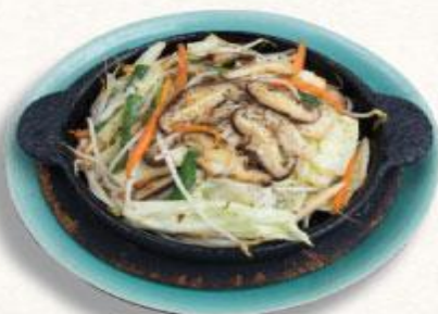
46 Rau nấm xào bơ tỏi Yasai to kinoko bata itame