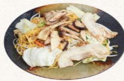
59 Mì xào thịt heo & nấm Kinoko yakisoba