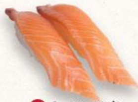
94 Sushi cá hồi Salmon