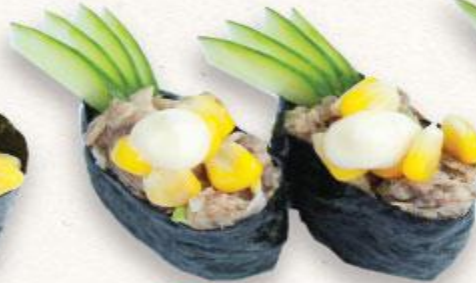
104 Sushi cá ngừ mayo Tuna mayo