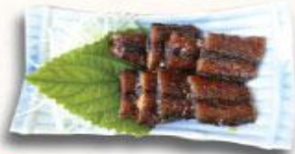
16 Cá Sanma nướng kiểu Kabayaki Sanma Kabayaki