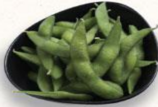
1 Đậu nành Nhật Edamame