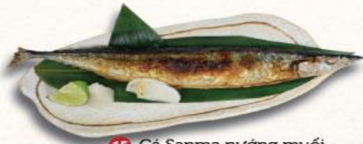
15 Cá Sanma nướng muối Sanma sio yaki