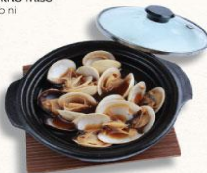
47 Nghêu hấp sake Hamaguri no sakamushi