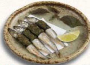
17 Cá trứng nướng muối Shishiyamo yaki