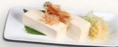
10 Đậu hũ lạnh cá bào Hiyayakko