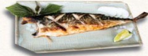
18 Cá Saba nướng Saba yaki