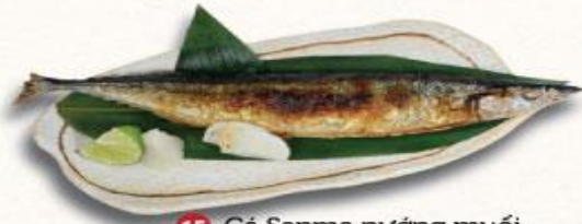
15 Cá Sanma nướng muối Sanma sio yaki