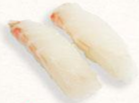
96 Sushi cá thịt trắng Shiromi sakana