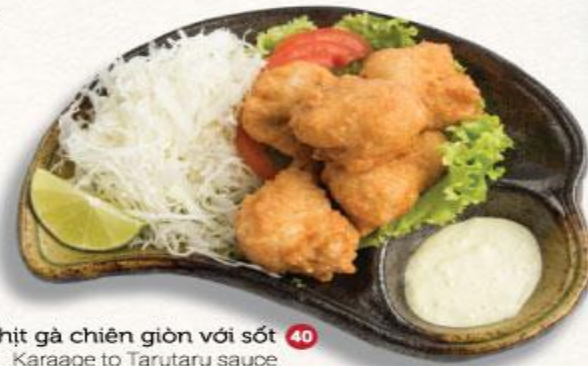
Thịt gà chiên giòn với sốt 40 Karaage to Tarutaru sauce