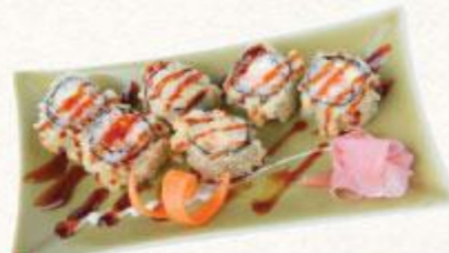
82 Cơm cuộn cá hồi chiên Tempura Tempura roll