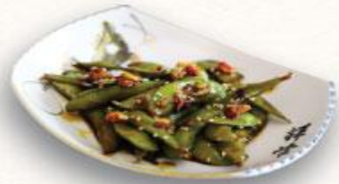
2 Đậu nành Nhật sốt Teriyaki Edamame to teriyaki sauce