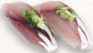
97 Sushi cá da ánh Hikarimono