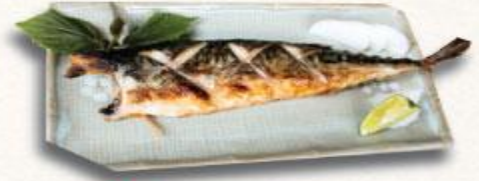
18 Cá Saba nướng Saba yaki