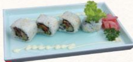
76 Cơm cuộn Sanma Kabayaki Sanma kabayaki roll