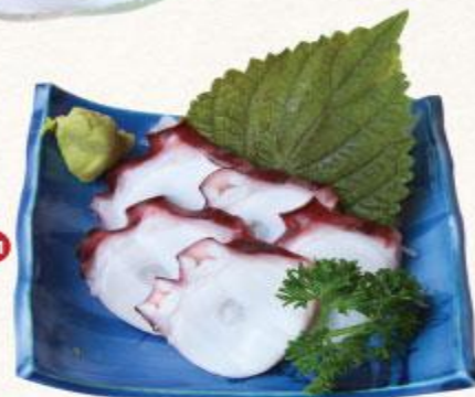
111 Bạch tuột Tako