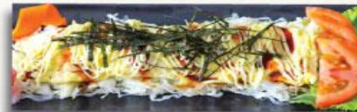
26 Trứng cuộn thịt heo Tonpeiyaki