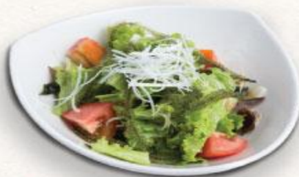
13 Xà lách rong biển Kaiso salad