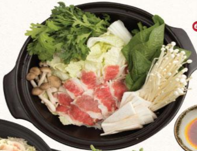
64 LẤU BÒ SA TẾ Spicy Gyu Nabe