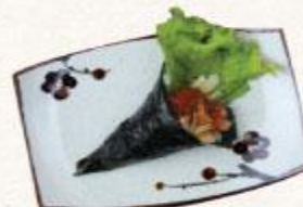
92 Gà teriyaki Toriteriyaki