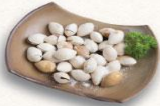
3 Bạch quả nướng muối Ginnan shoyaki