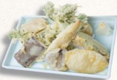
30 Tempura rau củ Yasaiten