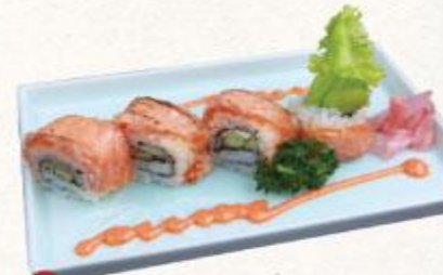
77 Cơm cuộn cá hồi nướng tái Aburi shake roll