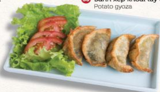
35 Bánh xếp khoai tây chiên Potato gyoza