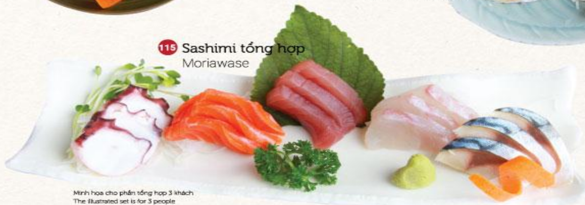
115 Sashimi tổng hợp Moriawase

Mình họa cho phần tổng hợp 3 khách The illustrated set is for 3 people