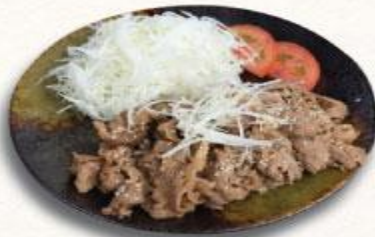
19 Bò ba rọi nướng sốt Gyuyakiniku