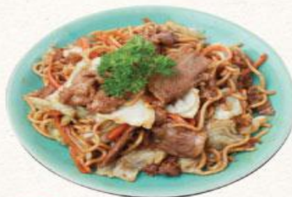
58 Mì xào thịt bò sốt kiểu Nhật Gyuniku sosu yakisoba