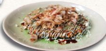
25 Bánh xèo kiểu Nhật Okonomiyaki